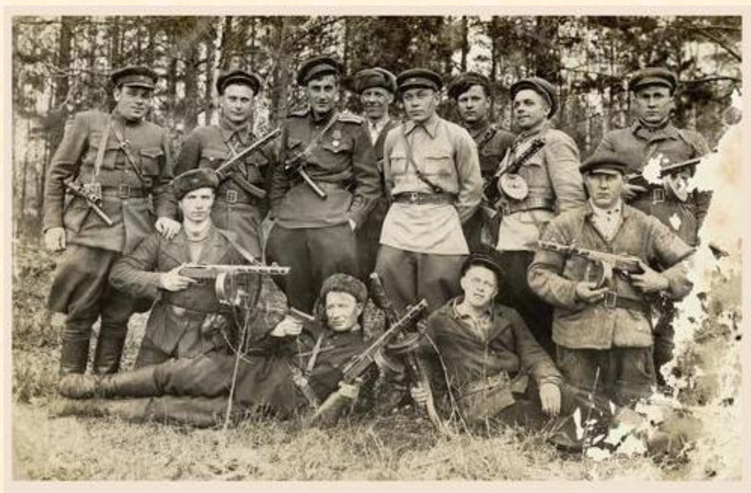
Группа партизан Слутчины. 1943г.

Люди не желали мириться с «новым порядком», который навязывали фашистские оккупанты. С первых дней войны в лесах формировались партизанские отряды, а в городах появились подпольные группы. В Беларуси партизанское движение нашло народную поддержку. К концу 1941 года уже 12 тысяч человек сражалось в 230 отрядах, а к лету 1944 года количество народных мстителей превысило 374 тысячи человек, которые объединились в 1255 отрядов.