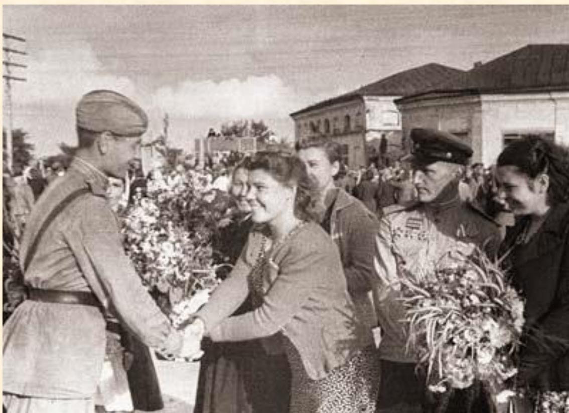
В. Аркашев. Встреча жителями Слуцка воинов одного из подразделений Красной Армии, освобождавших город от немецко-фашистских захватчиков. июль 1944г.

После 12 дней интенсивных боев первого этапа операции, главные силы немецкой группы армий «Центр» были разгромлены. Советская армия, продвинувшись на 225-280 километров, освободила большую часть территории Беларуси.