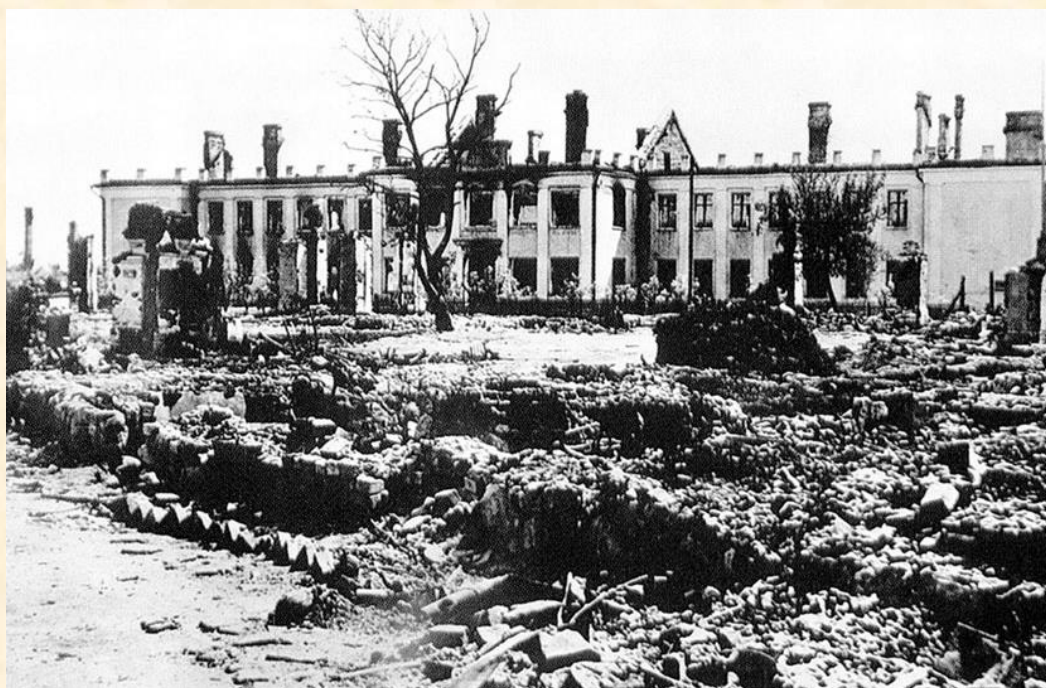
Слуцк. 1944г. Здание средней школы № 5

Три страшных года в республике царили террор, зверство и насилие. Фашисты не щадили ни детей, ни стариков, ни женщин. На нашей земле за годы нацистской оккупации было организовано 70 гетто и более 260 лагерей смерти. Гитлеровцы сожгли и разрушили 209 городов, свыше 9200 сел и деревень. Нацистские захватчики уничтожили 5295 населенных пунктов частично или вместе со всеми жителями.